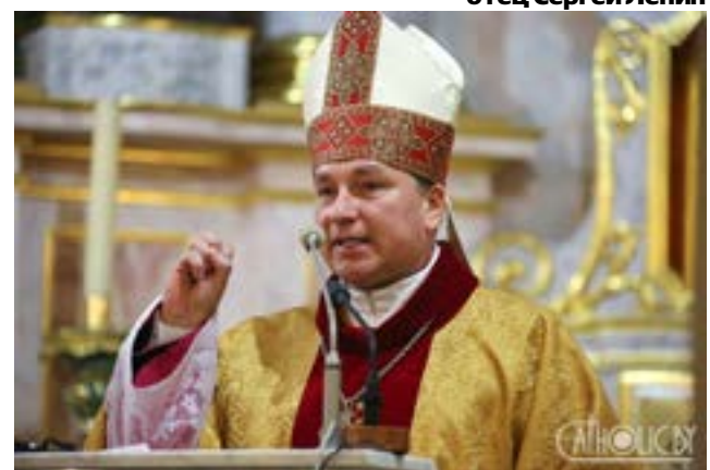
Епископ Минско-Могилевской архиепархии римско-католической церкви Юрий Кособуцкий