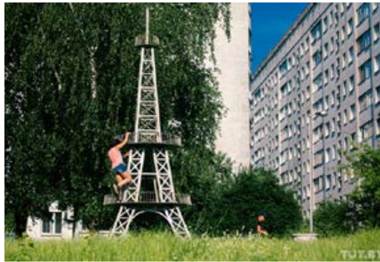
Вот так уменьшенная копия Эйфелевой башни в Минске выглядела совсем недавно — в июле 2020-го.

Собственная «Эйфелева башня» в микрорайоне Восток была около 15 лет. Говорят, она задуывалась как клумба для вертикального озеленения. Была интересной точкой для экскурсий по необычному Минску.