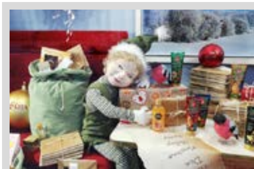
Так выглядел список 21 ноября - на нем видно желание «свобода».

Напомним, сейчас базовая ставка составляет 185 рублей. От ее размера зависит размер зарплат работников бюджетных организаций. Средние зарплаты бюджетников тем временем сокращаются третий месяц подряд. Реальные зарплаты, которые рассчитываются с поправкой на инфляцию, также падают.