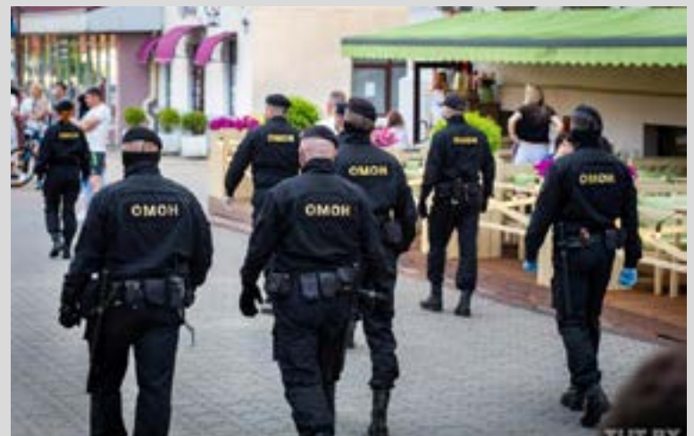
Фото использовано в качестве иллюстрации.