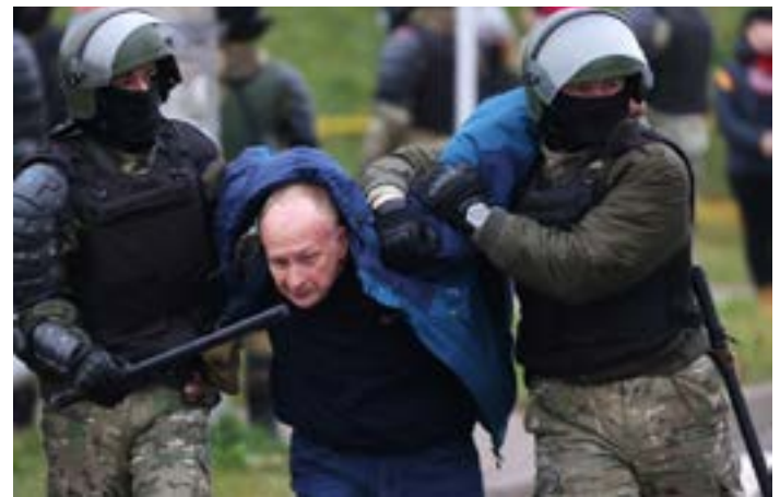
МИНСК, ОСЕНЬ 2020

Обустройство четверки полярников на громадной льдине площадью около 4 кв. км заняло около 16 дней. 6 июня самолеты покинули экспедицию, станция «Северный полюс — 1» перешла в режим автономного дрейфа, в котором она прошла около 2 тыс. км и спустя почти год прибыла в Гренландское море.