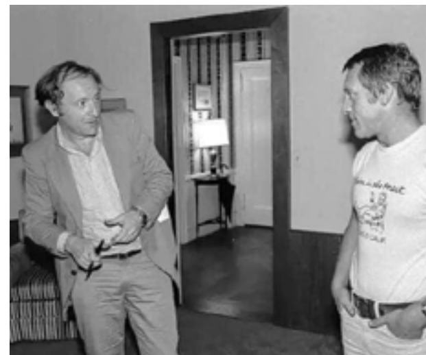
На фото – Владимир Высоцкий и Иосиф Бродский в квартире Михаила Барышникова. Нью-Йорк, август 1977 год.

Еще одну он надписал для своего старого знакомого актера Миши Козакова: «Передайте ему, пожалуйста, когда будете в Москве, другую – для Василия Аксенова «Он прилетел из Нью-Йорка в Па-