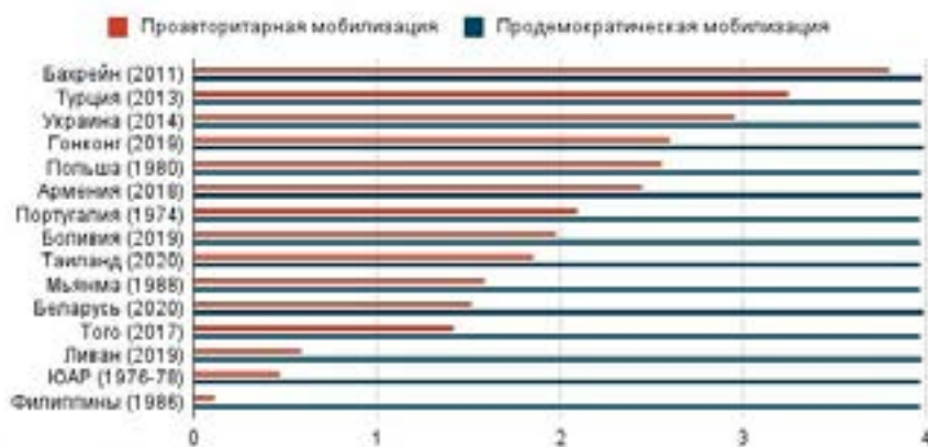
Графік 2. Пра-автарытарная мабілізацыя ў адказ на мабілізацыю стороннікоў дэмакратыі. 15 топ-случаев дэмакратычнай мабілізацыі (шкала ад 0 да 4)

І вось гэта будзе іграць вялікую ролю на наступных этапах. Млявыя прыхільнікі аўтакратыі супраць энэргічных і крэатыўных прыхільнікаў перамен. Тут сілы сапраўды няроўныя. Няроўныя на карысць дэмакратычнага руху.